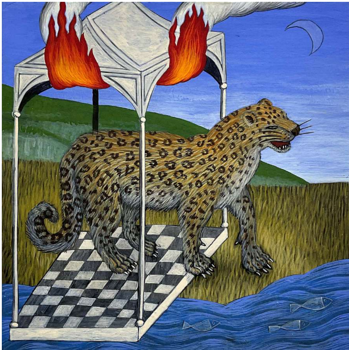
Thibaut Huchard, Léopard et l'amour , 2025, tempera, 20 x 20 cm

L'Œuvre foisonnant de Thibaut Huchard (né en 1987) entretient un dialogue singulier avec l'héritage des maîtres flamands. Nourri par l'univers des frères Van Eyck, de Jérôme Bosch ou encore de Joachim Patinir, l'artiste compose un monde peuplé d'animaux, de créatures hybrides et de scènes énigmatiques où se mêlent culture contemporaine et références à l'histoire de l'art en général et l'art flamand en particulier.